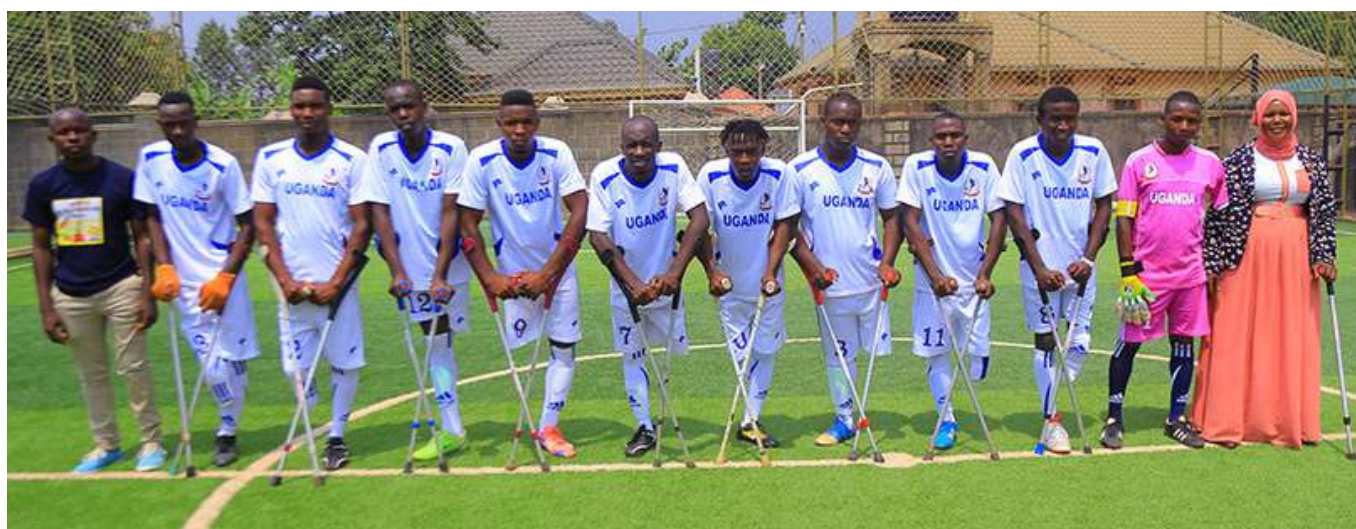
La squadra della Federation of Uganda Amputee Football Association (FUAF)