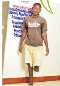
PROTESI IN PRODUZIONE

26 anni, amputato transtibiale a causa di un incidente stradale