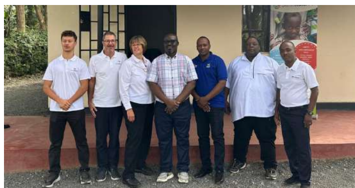
Il team SwissABILITY con le autorità presenti il primo giorno di formazione

La formazione ad Arusha si è svolta presso la nuova sede Arusha Prosthetics and Orthotics Centre (APOC). La maggior parte dei loro pazienti viene indirizzata loro dalla Selian Lutheran Hospital che si trova nelle vicinanze. Ospitare il team SwissABILITY durante la formazione di 16 tecnici provenienti da tutto il Paese ha contribuito a consolidarne la reputazione come centro protesico e ortesico affidabile in Tanzania.