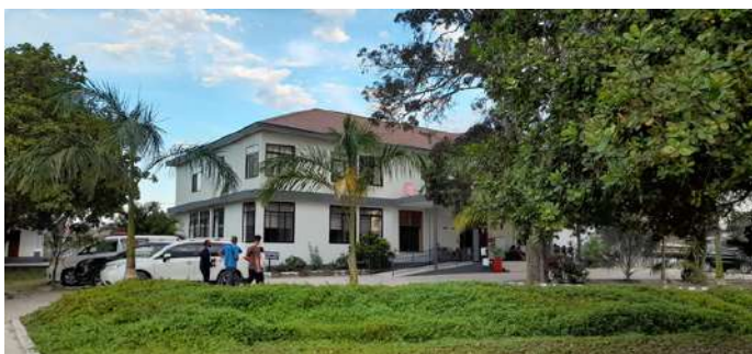
L'ospedale visto dalla cantina che serve spuntini semplici e convenienti.

Visitare questo ospedale è sempre un piacere, poiché è gestito e mantenuto in modo eccellente.